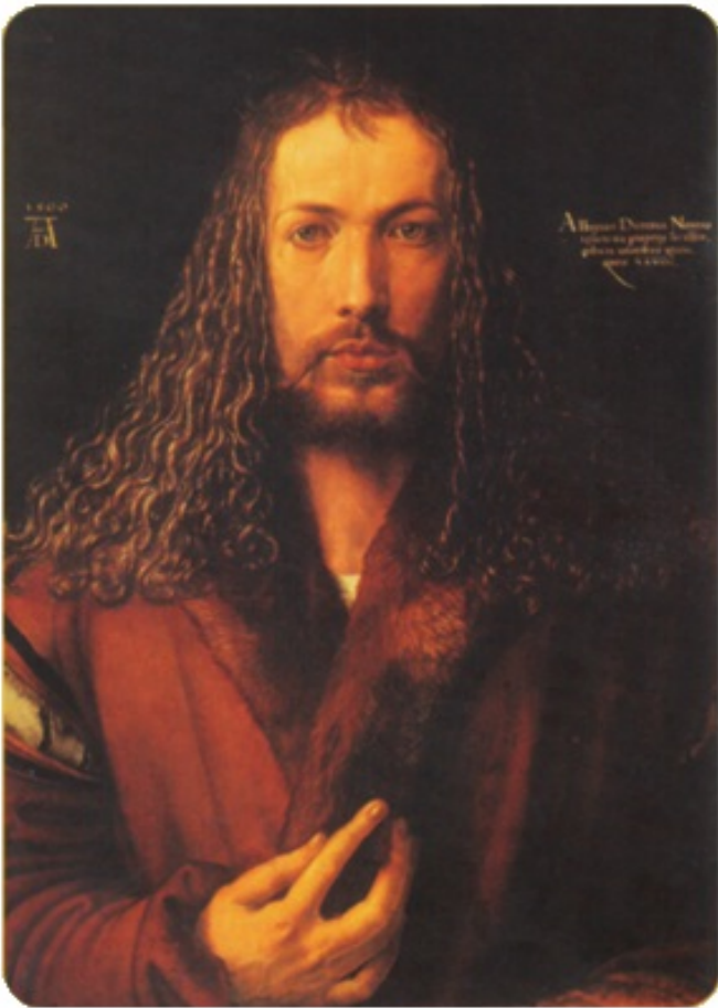
Албрехт Дирер: Аутопортрет

ЧАСОПИС ЗА ПОЛИТИЧКУ КУЛТУРУ И КУЛТУРНУ ПОЛИТИКУ